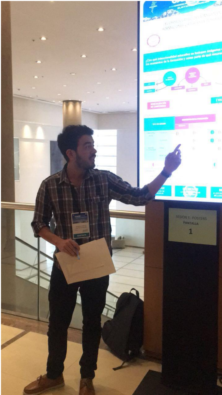
Congreso Argentina de Educación Médica (CAEM) 2018