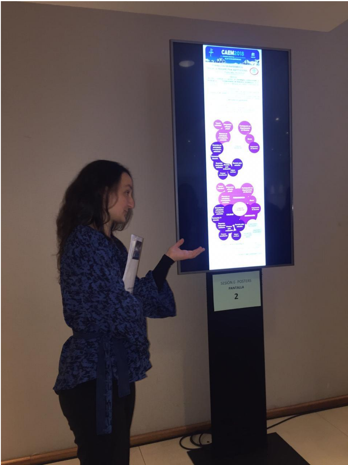
Congreso Argentina de Educación Médica (CAEM) 2018