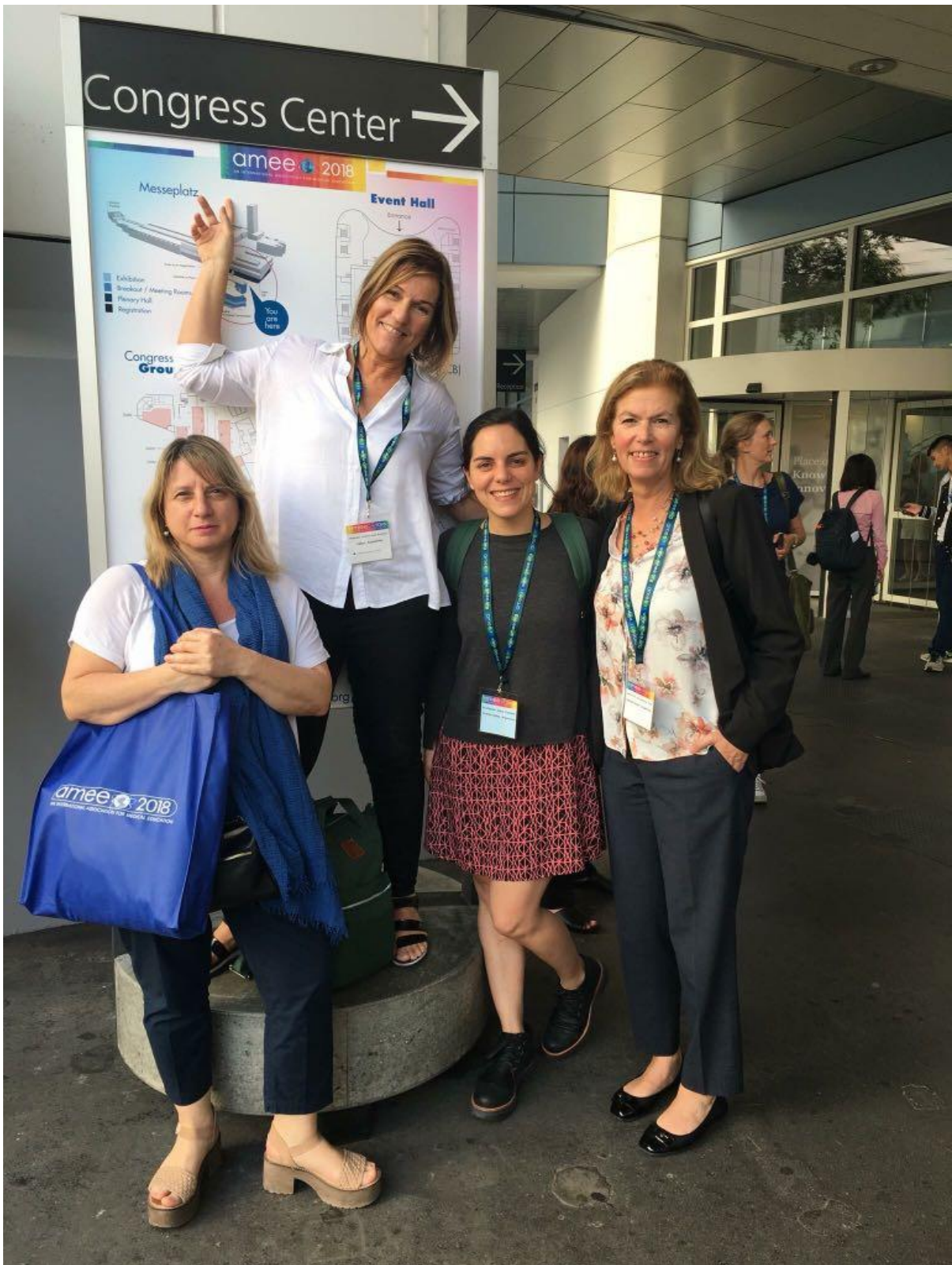
Congreso de Educación Médica AMEE 2018.

La actividad es gratuita, abierta a la comunidad y otorga créditos de actualización docente. Inscripción previa en: http://bit.ly/2v86liQ