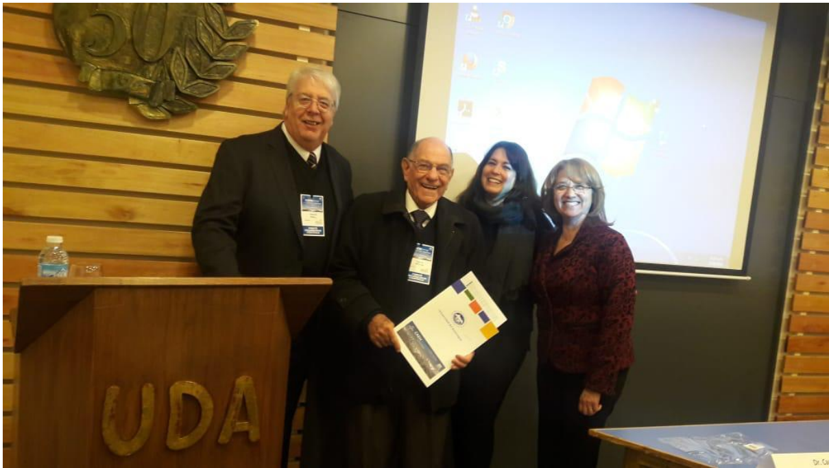
Congreso Argentina de Educación Médica (CAEM) 2018