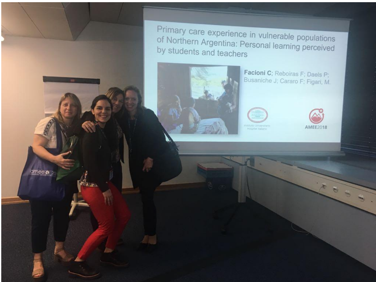
Congreso de Educación Médica AMEE 2018.